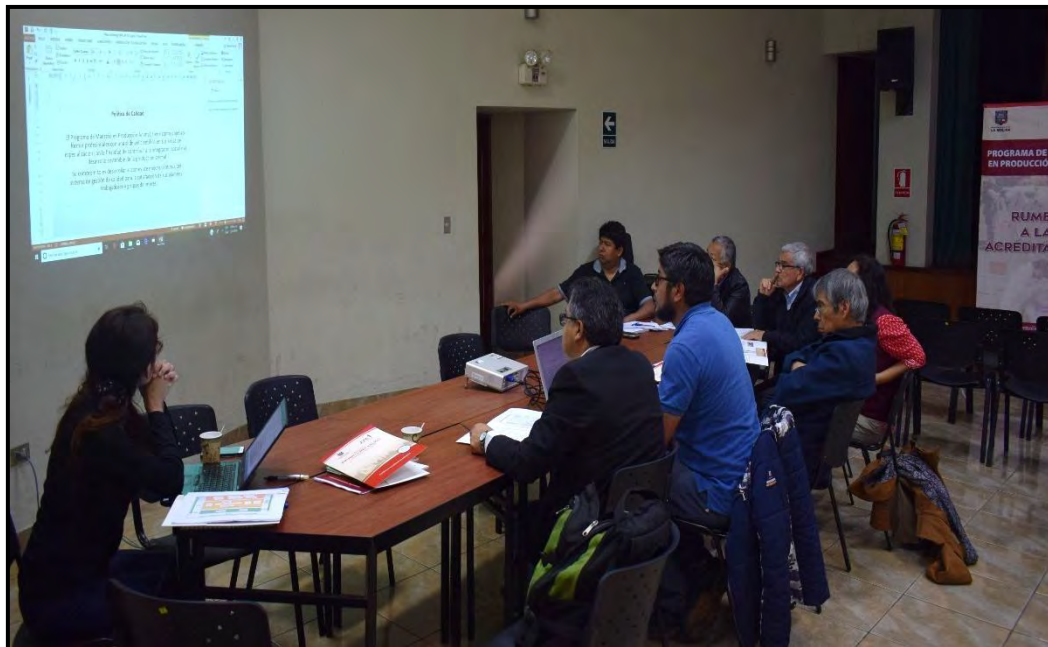
Foto 2 Análisis de la información

En este taller se revisó el Plan de Mejora Continua del PMPA, luego de la explicación los miembros de la mesa de trabajo dejaron algunas observaciones preliminares, sin embargo; debido a la falta de tiempo para poder continuar con el debate se coordinó con los asistentes el dar un plazo de 10 días para poder entregar sus observaciones finales para incorporadas en el documento final.