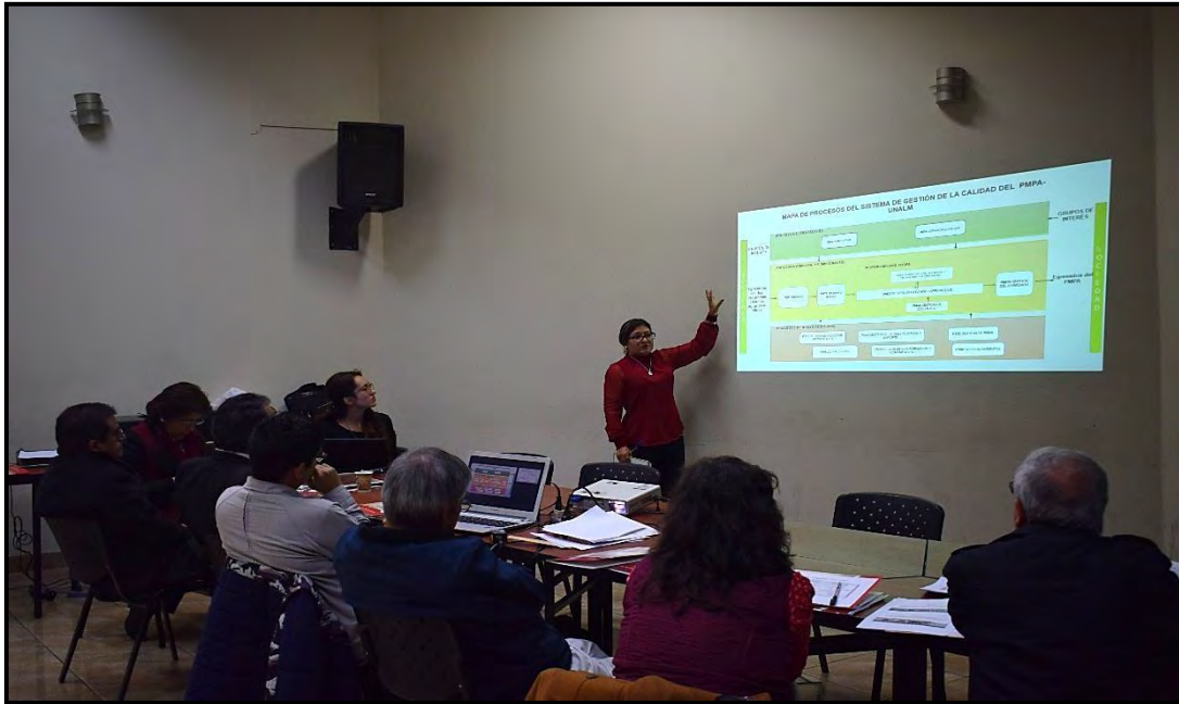
Foto1. Mesa de trabajo

La mesa de trabajo estuvo compuesta por miembros del comité consultivo (CC), comité de calidad y acreditación (CCA) del PMPA, docentes y alumnos. Una vez conformado el grupo, se procedió a mostrar y explicar algunos detalles adicionales del mapa de procesos, la política de calidad y el plan de mejora continua, luego la mesa de trabajo hizo sus observaciones sobre estos puntos que fueron recopilados por un moderador.